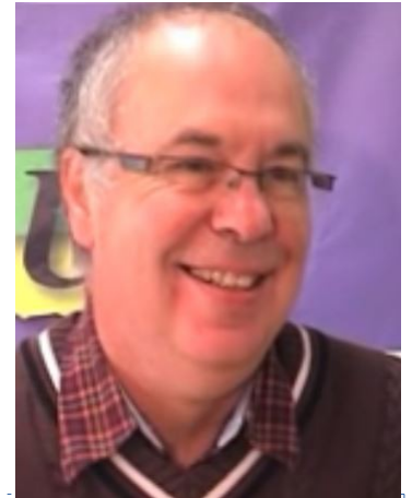
INTERVENTION DE F. VERGNE

Face à l'isolement quotidien dans les établissements et face à l'administration, c'est un moment de rencontres, d'outillage collectif.